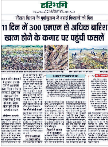
नारनौल। हरिभूमि में 3 अगस्त को प्रकाशित समाचार।

प्रदेश सरकार ने बारिश से फसलों में हुए नुकसान को देखते हुए महेंद्रगढ़ जिले के लिए भी ई क्षतिपूर्ति पोर्टल खोल दिया गया है। यह पोर्टल हरियाणा सरकार ने किसानों को मांग पर उनको राहत प्रदान करते हुए खोला है, ताकि प्राकृतिक आपदाओं से प्रभावित किसान अपनी फसलों के नुकसान का दावा ऑनलाइन दर्ज कर सकें। पोर्टल पर आवेदन करने के लिए किसानों को अपनी फसल की जानकारी व नुकसान का ब्यौरा देना होगा। ई क्षतिपूर्ति पोर्टल पर फसल खराब का पंजीकरण किसान स्वयं या सीएससी सेंटर जाकर करवा सकते हैं।