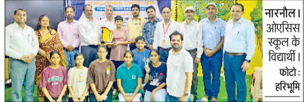
नारनौल। ओएसिस स्कूल के विद्यार्थी।